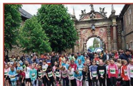
Ob Groß oder Klein, jedes Sportevent zieht jedes Jahr mehr sportbegeisterte Teilnehmer zum bereits 8 mal stattfindenden Sparkassen-Schlossparklauf in Bückeberg an.