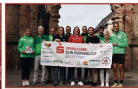
Ohne starke Unterstützung nicht möglich: Zahlreiche Sponsoren tragen zum Erfolg des Sparkassen-Schlossparklaufs in Bückeberg bei.