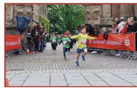
Mit strahlenden Gesichtern im Ziel: Die Bambinis absolvieren ihre Strecke mit großer Begeisterung und werden für ihren Lauf gefeiert.